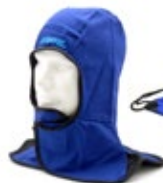
Gorra tipo monja