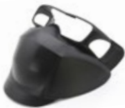
Careta facial anti-proyecciones