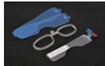
Adaptador gafas graduadas y 2 protectores frontales