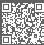
Gala MIG 2700i