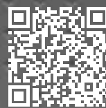
Gala MIG 5000i