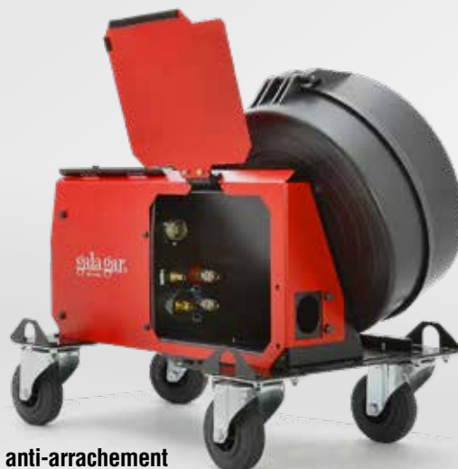
Systeme de connexion anti-arrachement